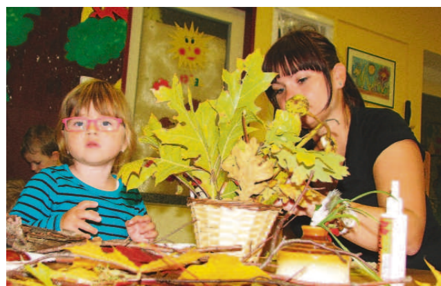
TVOŘIVÉ DÍLNÍČKY s podzimní tématikou uspořádala mateřinka Pošumavská v Tachově. Pozvaní byli také rodiče a ti se spolu s dětmi zapojili například do tvoření obrázků obličejů. K tomu používali krom podzimně zbarveného listí také kaštiny, ořechy, jeřábiny, mech, ovoce, šípky nebo šišky. Tvořivé dílny se konaly minulý týden ve třídě Ježečků.