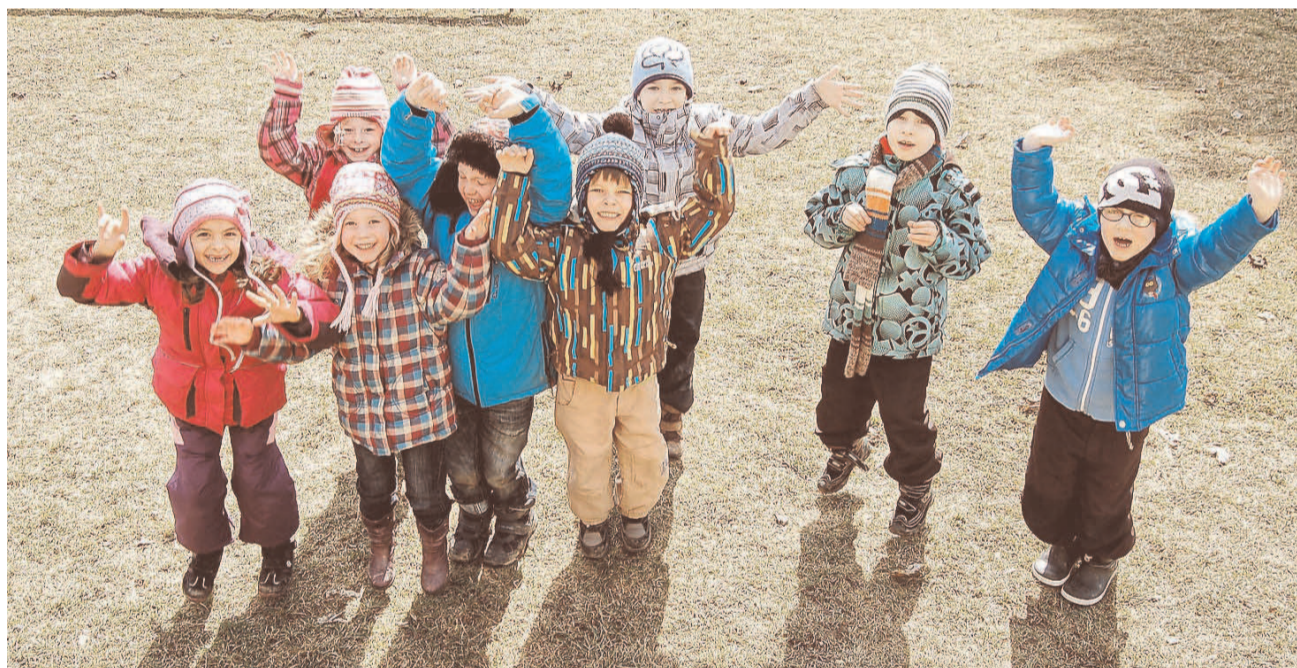
PŘESNĚ PO ÚDERU DVANÁCTÉ HODINY 20. března Slunce vstoupilo do znamení Berana a začalo astronomické jaro. První jarní den vykukovalo Slunce skrz mraky, a nástup nejhezčího ročního období vítaly také děti, které se za tím účelem sešly na zahradě. Náš snímek zachycuje radost chlapců a děvčat z tachovské mateřinky Pošumavská.